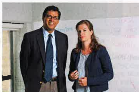
Gawande, SPIEGEL-Redakteurin* „Ich werde alt“

Gawande: Die meiste Zeit des Tages schlief er, und wir saßen einfach bei ihm im Zimmer. Wenn er aufwachte, redeten wir. Die