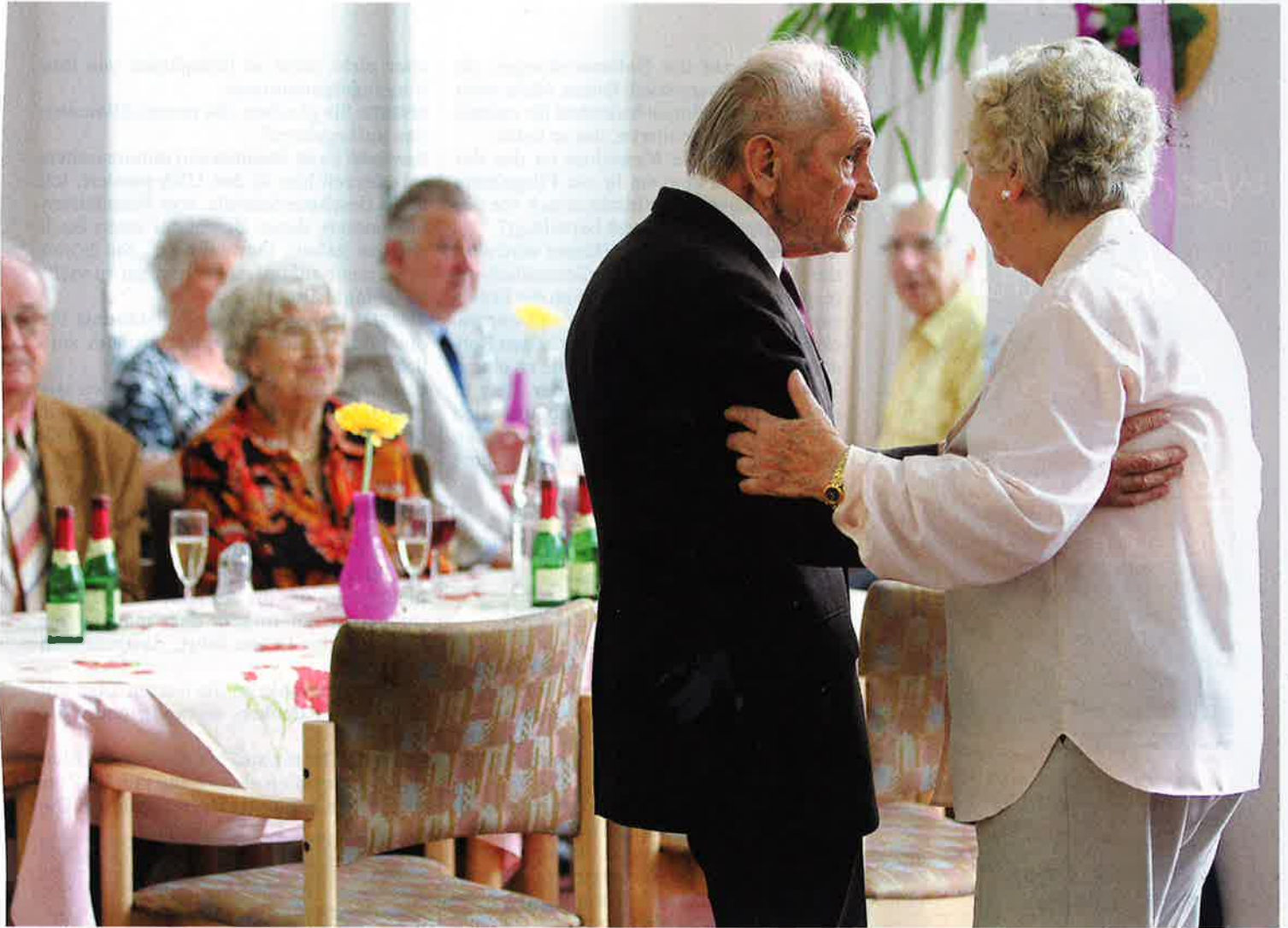
Bewohner bei Tanzstunde im Seniorenheim: „Das Wertvolle an einem Zuhause ist doch, dass man Herr in seinem Haus ist“

sah, dass die Darmschlinge festsaß, setzten wir lediglich Schläuche ein, um ihre Übelkeit zu lindern. Die Patientin starb Tage später im Beisein ihrer Familie.